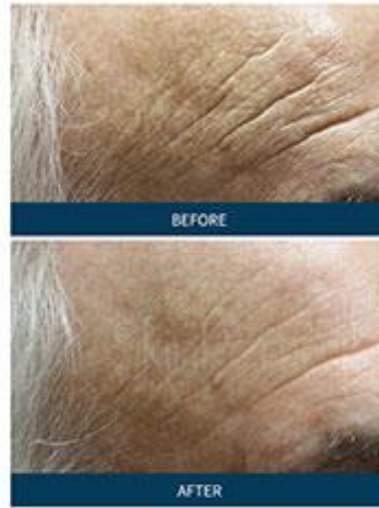
BELLUS MEDICAL Male | Age: 72 | 9 Months After 5 Procedures