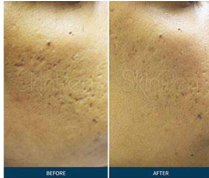
BELLUS MEDICAL Male | Age: n/a | Procedures: 5