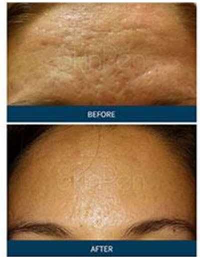
Female | Age: n/a | Procedures: 6