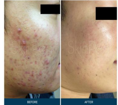
BELLUS MEDICAL Male | Age: 26 | Procedures: 3

Nach der Anwendung kann die Haut aussehen wie bei einem leichten bis mittleren Sonnenbrand (1 bis 4 h danach) wie hier abgebildet: